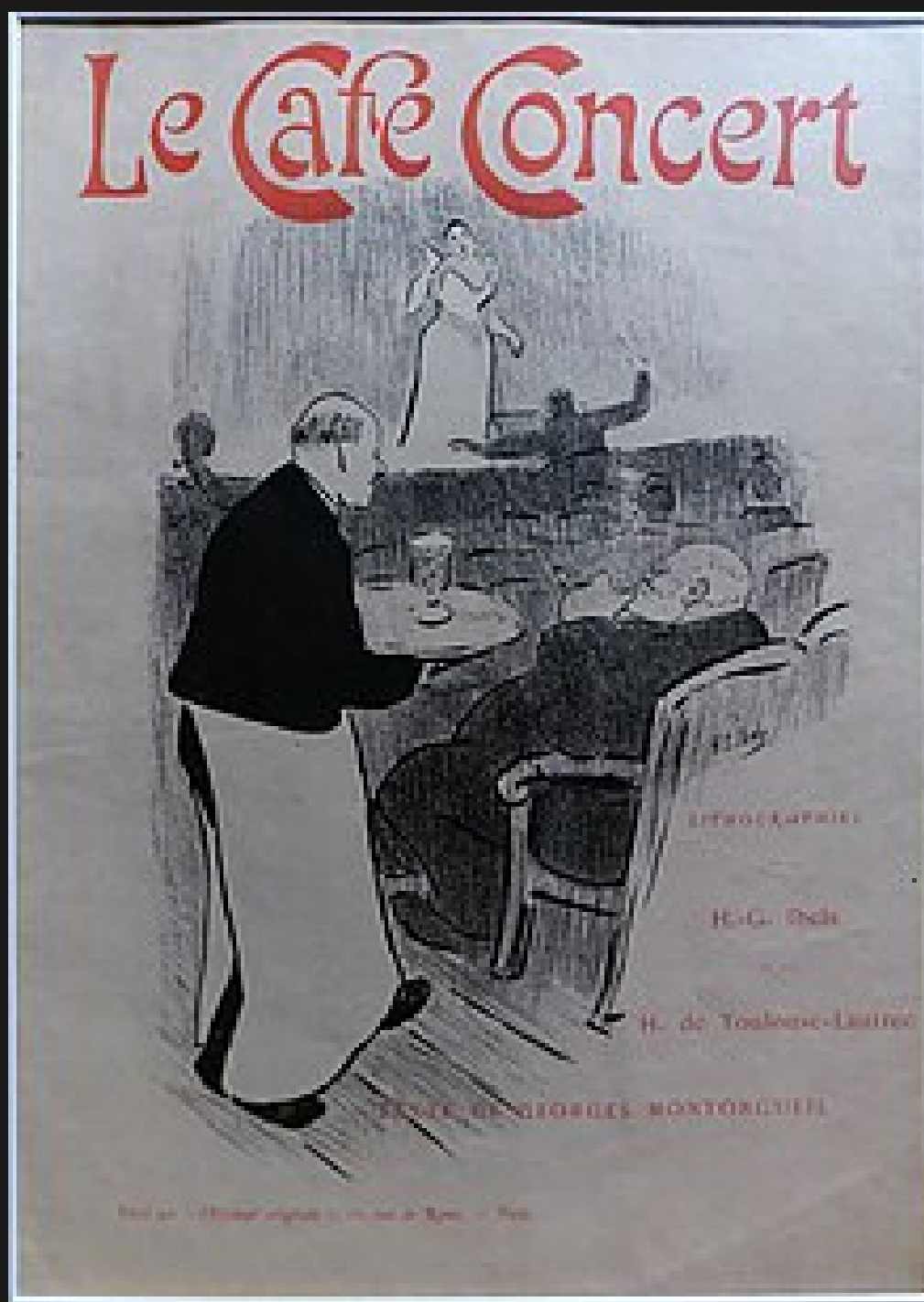
Un Café-concert in una litografia di Henri-Gabriel Ibels