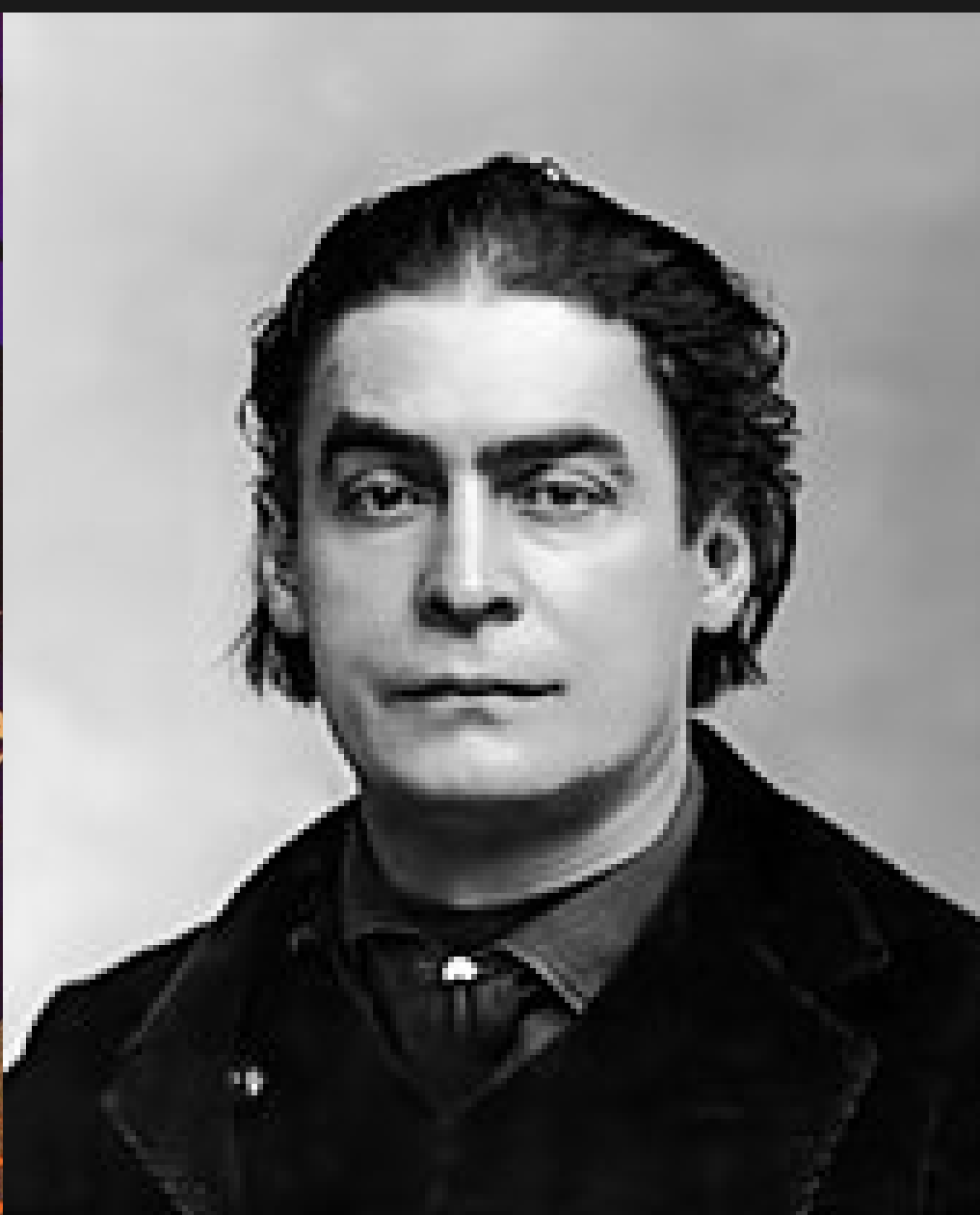
Aristide Bruant vicino al suo ritratto