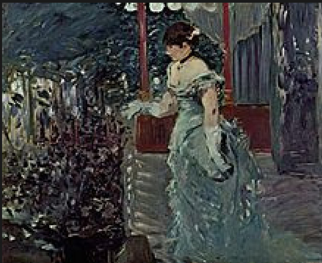
La Chanteuse du Café-Concert di Édouard Manet